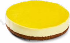
CHEESECAKE MANGO CITRON