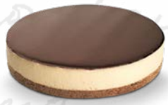
CHEESECAKE VIT CHOKLAD