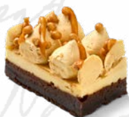
JUBILEUMSBKELSE HASSELNÖT KOLA