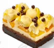
JUBILEUMSBKELSE PERSIKA CITRON