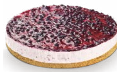
CHEESECAKE YOGHURT BLÅBÄR