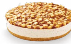
CHEESECAKE ÄPPLE KANEL