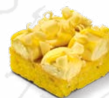
CITRON & PASSIONFRUKTS- BAKELSE