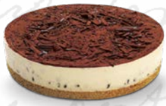
CHEESECAKE CHOCOLATE CHIP