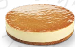
CHEESECAKE SALTED CARAMEL