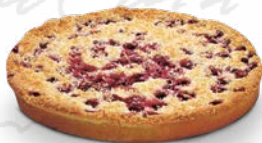
KLADDKAKA VIT CHOKLAD HALLON