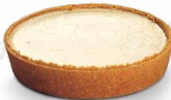
JUUSTOKAKKU NEW YORK

TUOTENRO: 7914 MÄÄRÄ - PAINO/PAKK.: 4 x 1 kpl x 1 350 g