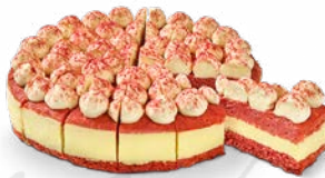
JUUSTOKAKKU RED VELVET VADELMA-SITRUUNA

VIIPALOITU, 14 PALAA: 6514 MÄÄRÄ - PAINO/PAKK.: 2 x 1 kpl x 1 700 g